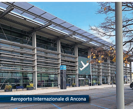
Aeroporto Internazionale di Ancona