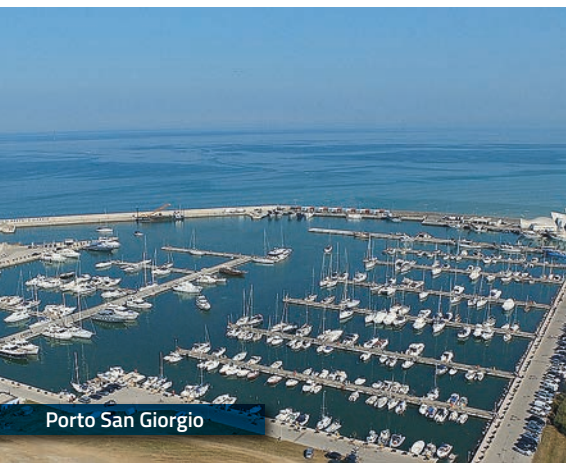
Porto San Giorgio

L'innovativo progetto Fermo Deaf Friendly City fa parte del più ampio programma "Marche for All", cioè "Marche per Tutti", co-finanziato dal Ministero della Disabilità e dalla Regione Marche. L'obiettivo principale di questo progetto, che si iscrive nel quadro delle politiche per un turismo accessibile, è quello di ospitare i turisti sordi facilitando un soggiorno senza barriere comunicative e una completa immersione nel suggestivo paesaggio marchigiano e nelle sue meraviglie storiche e artistiche. Il progetto parte da Fermo – riconosciuta come "Città Unesco dell'Apprendimento" – e Porto San Giorgio, ma si proietta su tutta la Provincia di Fermo e su tutta la Regione Marche. Cuore pulsante del progetto saranno i corsi di sensibilizzazione alle lingue dei segni per gli operatori pubblici e privati della comunità locale che avranno contatti con i turisti.